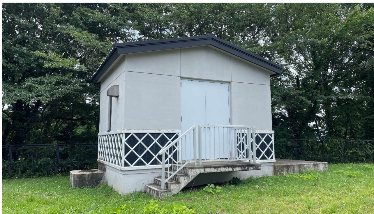
庄内広域水道 松山量水所