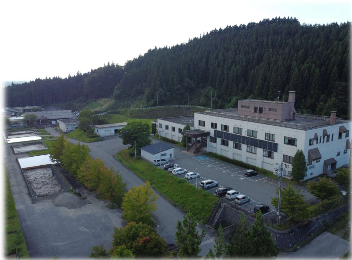
最上広域水道 金山浄水場