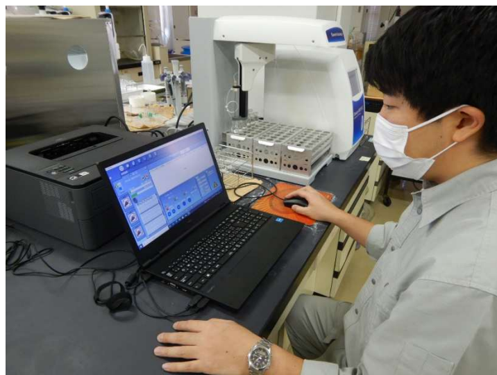
有機物（全有機炭素（TOC）の量）の検査