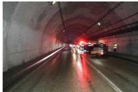
【Aの進行方向から見た現場の状況】

対向はみ出しの死亡事故は今年4件目！！ 同形態における過去5年間の死亡・重傷事故は147件(R2～R6合計)