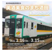
陸羽西線運転再開記念キャンペーン（R7）

・沿線住民が日常的に鉄道を利用するきっかけとなるよう、通勤・通学や買い物等での鉄道利用に特典を付与することで鉄道利用を促進する取組を支援。（R8から通勤・通学での利用も対象）