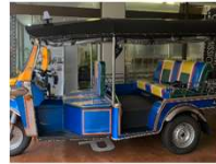
新庄駅併設ゆめりあトックトック（三輪自動車）導入（R7）

・鉄道の利用拡大や利便性の向上に資する構想の具体化等の検討に必要な実証実験に対して支援（駅を基点とした自動運転バス、鉄道の運行本数増加の実証 など）。※調査のみの事業は対象外