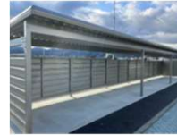
羽前長崎駅駐輪場整備（R7）