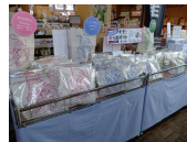
ゆめりあエコバッグ（R6）

・県内鉄道の路線名、駅名、愛称等を商品名に冠するなど県内鉄道路線に関連した特産品の開発を支援。