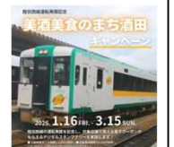
陸羽西線運転再開記念キャンペーン（R7）