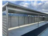
羽前長崎駅駐輪場整備（R7）