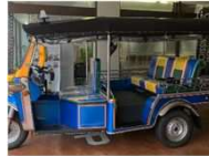
新庄駅併設ゆめりあトックトック（三輪自動車）導入（R7）

・鉄道の利用拡大や利便性の向上に資する構想の具体化等の検討に必要な実証実験に対して支援（駅を基点とした自動運転バス、鉄道の運行本数増加の実証 など）。※調査のみの事業は対象外