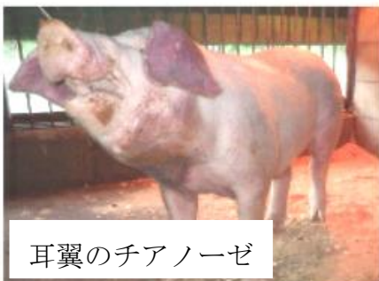
耳翼のチアノーゼ

豚熱は豚やイノシシの伝染病で、 発熱や食欲不振 の他、豚房の片隅に体を寄せ合っ てうづくまる 、 パイルアップ や 結膜炎 が特徴です。