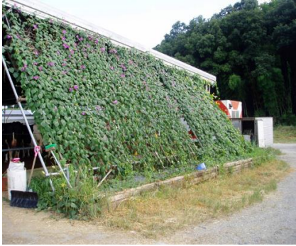
グリーンカーテンの設置