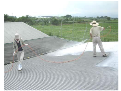
屋根への石灰塗布