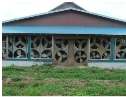
換気扇、送風機の稼動