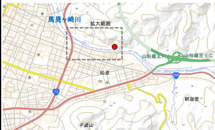
引渡し場所位置図