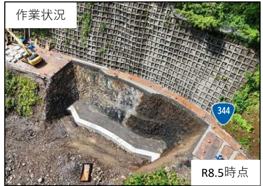
▲(国)344号(酒田市北青沢) 【遠田建設株】