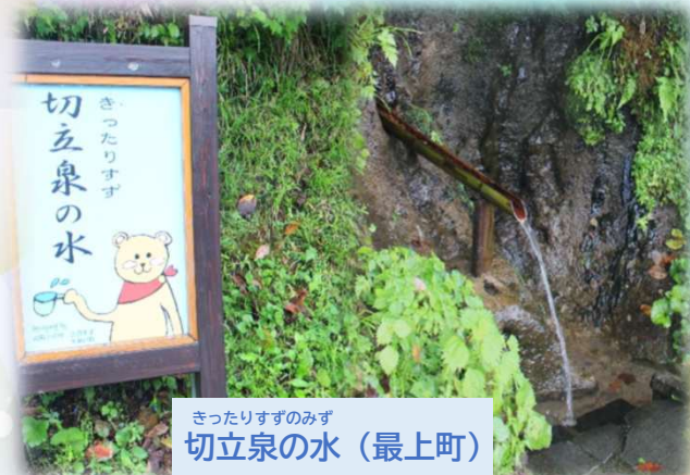
きつたりすずのみず 切立泉の水（最上町）