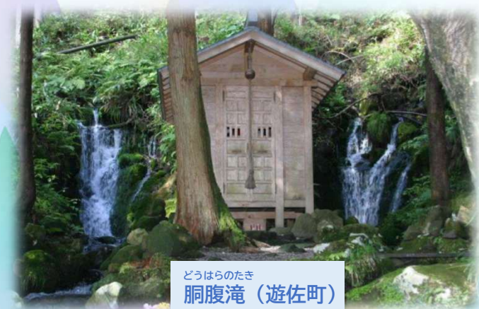
どうはらのたき 胴腹滝（遊佐町）