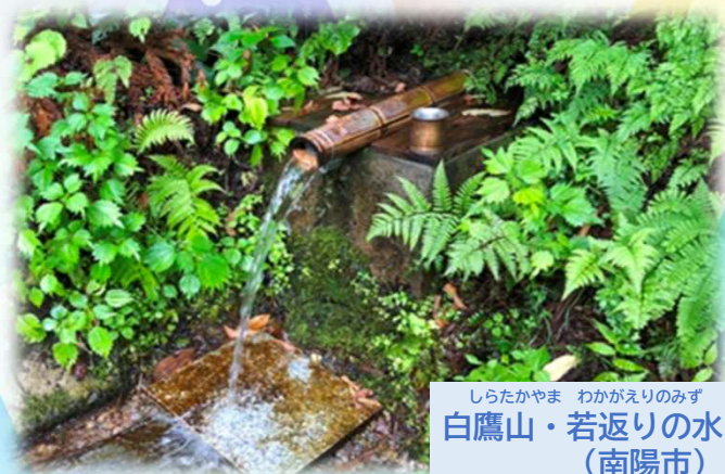
しらたかやま わかがえりのみず 白鷹山・若返りの水 （南陽市）

県では、地域の湧水を守り大切にしている取り組みを県内全域に広げ、水環境の保全に役立てています。あわせて、観光資源や地域おこしへの活用にもつなげていきます。