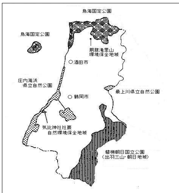
【表71】自然公園面積（令和7年3月31日現在）