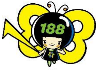
消費者庁 消費者ホット ライン 188 イメージキャ ラクター イヤヤン