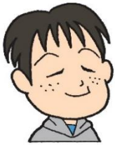
ケロちゃんファミリー 「まもるくん」

インターネットは便利だな～。家にいながら買い物できるし、商品やサービスに関する情報が簡単に手に入れられるよ。