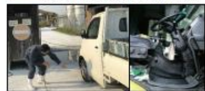
車両はタイヤだけでなく、泥よけの内側まで消毒し、フロアマットの交換やペダル等車内も消毒