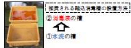
推奨される踏込消毒槽の設置方法