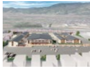
上山高等養護学校・山形盲学校改築完成イメージ

新庄志誠館高等学校整備、上山高等養護学校・山形盲学校改築、県立高等学校のトイレの洋式化や特別教室へのエアコン整備等を進めます。