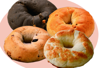
紀ノ国屋のベーグル 上段：ココアホワイトチョコ・メープルウォルナッツ 下段：ブルーベリー New! ・チーズ New! ランチにもおやつにも！ 色んな味を食べ比べられる、 パリエーション豊かなベーグルです。