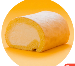
New! 堂島ロール(ハーフ) あの「堂島ロール」が新庄初上陸！ “クリームを味わう” ロールケーキ