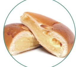
紀ノ国屋のクリームパン しっとり柔らかな生地につぶりカスタード！ 上品な甘みのクリームパンです。