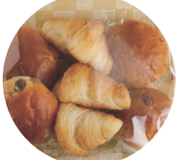
New! モーニングセット(紀ノ国屋) 3種類のプチパン詰合せ！ 忙しい朝の朝食にもぴったりです。