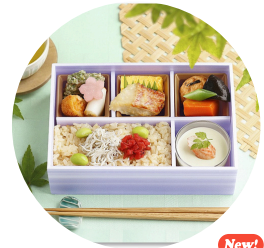
New! 初夏の涼味(なだ万) 出汁の効いた生姜ご飯は 初夏にぴったりのさわやかマ！ なだ万自慢の赤魚西京焼と 一緒にお楽しみください！