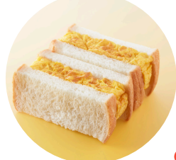
New! 松露サンド(つきぢ松露) 甘み溢れ出すジューシーな玉子焼を挟んだ 贅沢なサンドイッチです。