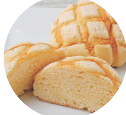
紀ノ国屋のメロンパン 生地でも皮にも発酵バターを使用した、 ふんわりくちどけの良いメロンパンです。