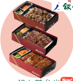
叙々苑 焼肉 叙々苑 New! 叙々苑弁当 上から牛蒡切弁当、カルビ弁当、サーロイン弁当 芸能界御用達！ 東京・六本木発祥の焼肉店「叙々苑」 の味をぜひご家庭へ召し上げ！