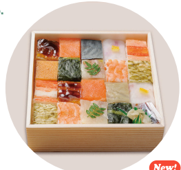
New! 浪花寿司(古市庵) 穴子や海老などを一口サイズで 味わえる、彩豊かな寿司弁当です。 見た目も楽しく食べやすい！