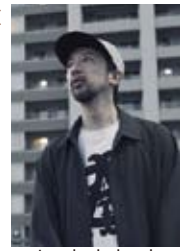
mica the bulwark