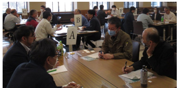
● 情報交換会の様子