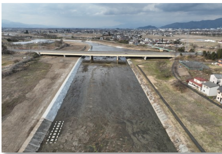
馬見ヶ崎川河川改修工事 完成

市町と連携したクマ対策を推進するとともに、治水や土砂災害対策などを着実に進め、安全・安心な地域づくりと県土強靱化に取り組めます。