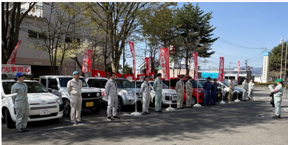
● 山火事防止啓発ウィーク出発式の様子