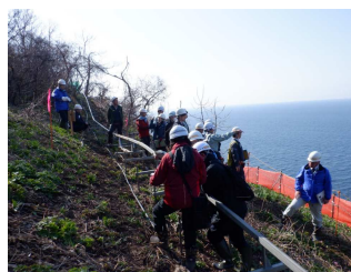
専門家現地調査状況