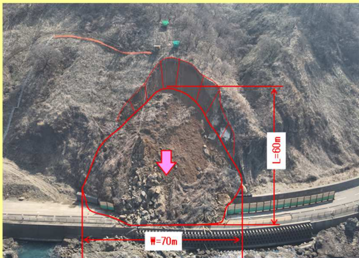
・道路を完全に塞いでしまいました・・・